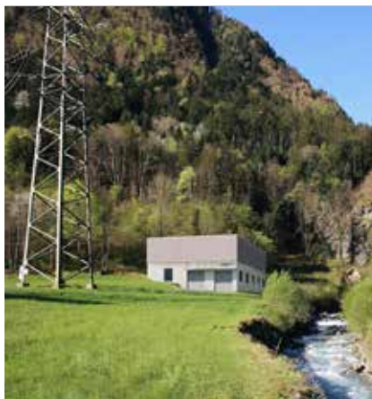
Visualisierung der Kraftwerkszentrale

Freundliche Grüsse Kraftwerk Erstfeldertal AG