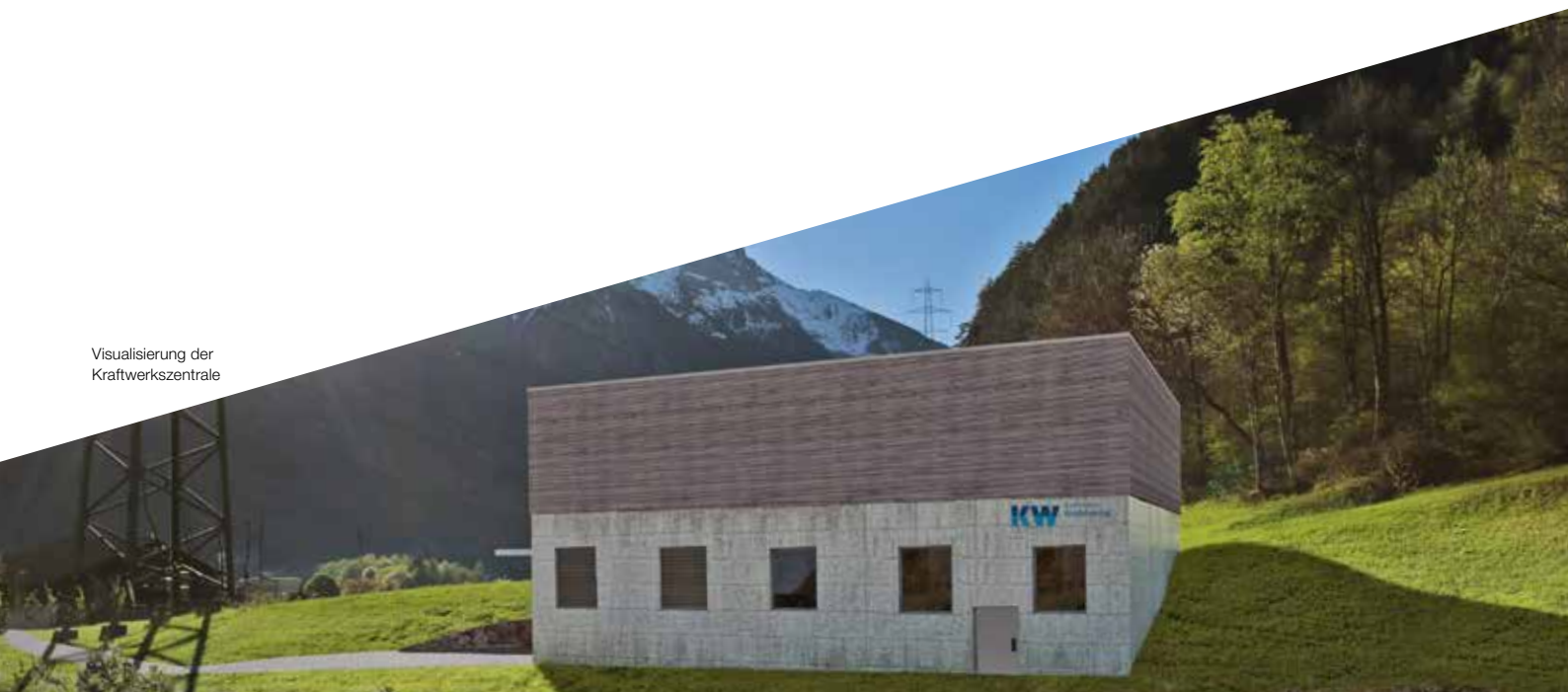
Visualisierung der Kraftwerkszentrale